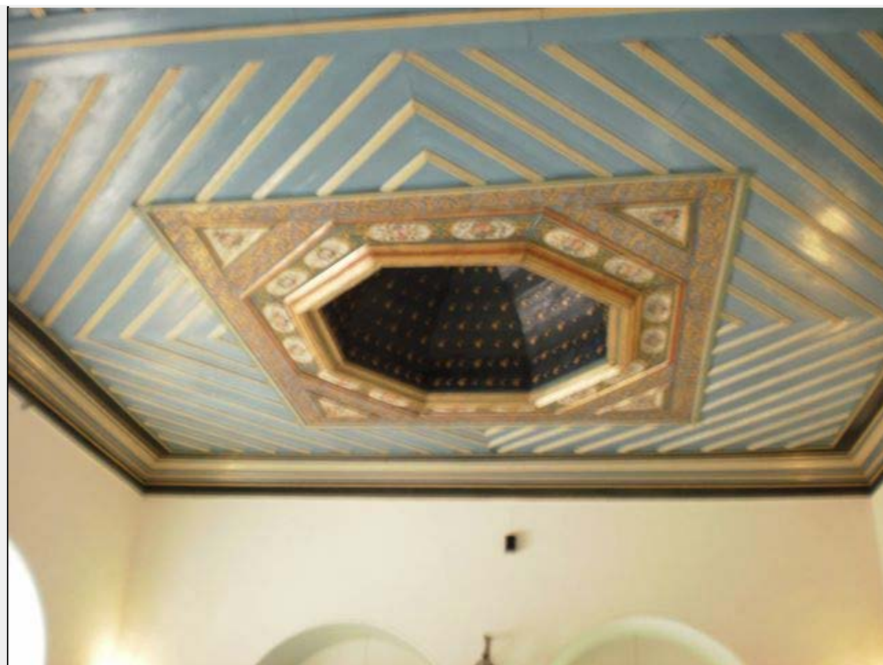
לכל חדר עיטורי תקרה אחרים, כולם נעשו ביד אמן.

תמונות אלו תורמות להבנה מלאה יותר של ההשראה לעיצוב הפנים והחוץ של החדרים, מתוך כבוד רב להיסטוריה ולתרבות השוקקת כבר קרוב למאה שנה בתחומי אמריקן קולוני. בקומה השנייה, הקרניזים שהיו בעבר תקרת המבנה, הושארו חשופים במסדרון, כדי לספר גם הם את סיפורו של המבנה לבאים להתארך.