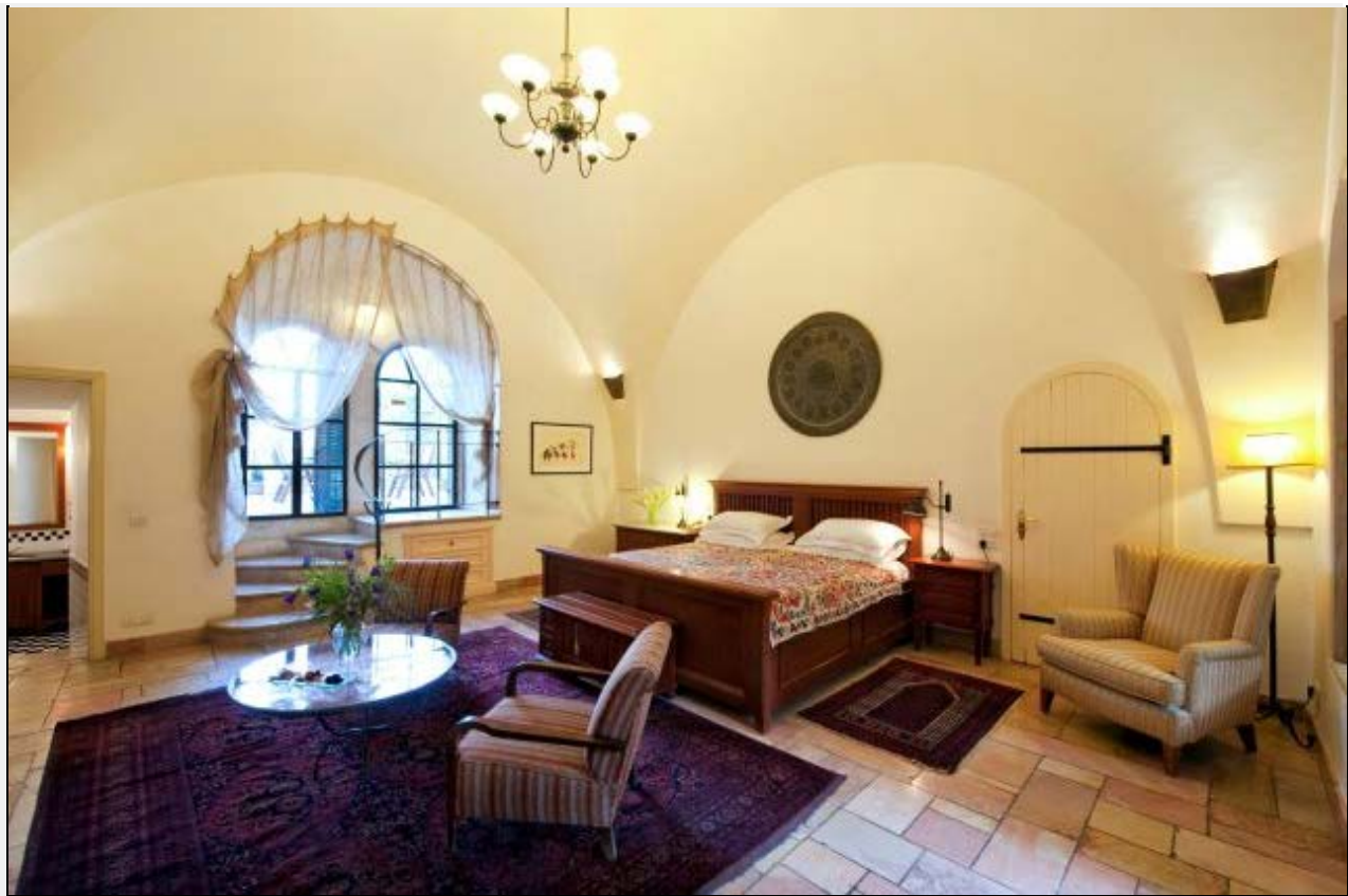
סוויטת הדה לקס, פאשה. האחוזה נבנתה בצורת ארמון. כיום יש במלון מספר אגפים ו-96 חדרים, (צילום: אמריקן קולוני)

מלון אמריקן קולוני במזרח ירושלים נחשב לאחד ממלונות הבוטיק הידועים בעולם והתארחו בו מפורסמים רבים, מצ'רצ'יל, דרך רוברט דה נירו ועד בוב דילן. לייחוד שלו תורמת האווירה האוריינטלית והבינלאומית כאחד במקום. חרף מיקומו, המלון, שהוא בבעלות פרטית של ירשי משפחות המייסדים השבדים, הבריטים והאמריקאים, מנוהל על ידי חברת גאואר השווייצית וחבר ברשת שיווק המלונות היוקרתית The leading hotels of the world.