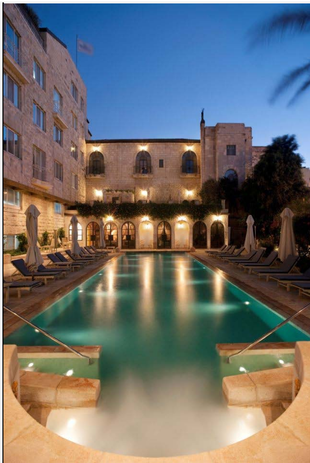
ברכת השחיה במלון אמריקן קולוני. התל אביבים באים בסופי שבוע.

(TripAdvisor.com, אתר הנסיעות המשפיע ביותר בענף הנסיעות והנסמך על חוות הדעת של גולשיו), הוא קורא כמה ביקורות טובות, כמה בינוניות וכמה רעות. "ואני מגלה שהביקורות הרעות הן של אדם שהתרגז על משהו, ואולי מלון של חמישה כוכבים הוא לא בשבילו. צריך לעשות אנליזה לביקורות".