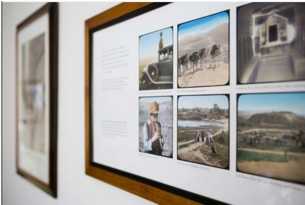
צילומי התערוכה מייצגים את יצירתם יוצאת הדופן של קבוצת צלמי המושבה האמריקנית (1898-1934). הם מהווים תיאור רב-מימדי ונעדר גבולות של מזרח תיכון לא ידוע.

לאומנות המקומית ולהכניסה תוך כבוד אל פנים המלון. את וילונות הבורדו התלויים בכל החדרים, ייצרו נשים ממזרח ירושלים ואילו קרמיקות ארמניות מעטרות את המראות בחדרי האמבטיה ואת הכניסה למלון. את ידיות הדלתות סיפק אומן ברזל מתל אביב. לשם ביצוע עיצוב התאורה, נעזרו בבעלי חנויות וסדנאות בשוק הפשפשים ביפו ואת השטיחים קנו בסיועו של בעל חנות לשטיחים עתיקים.