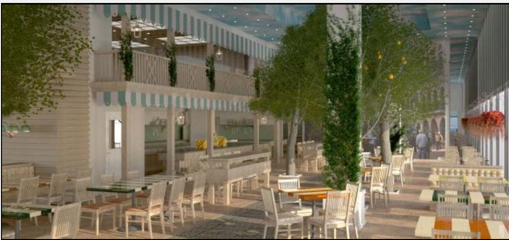
חדר האוכל בהרודס תל אביב של רשת פתאל. המלון עם ההכנסות הגבוהות ביותר.

בכמות הלינות למלון מעל 50 חדרים זכה מלון לאונרדו באזל מרשת פתאל ובמלון בעל ההכנסה הגבוהה ביותר – מלון הרודס תל אביב, אף הוא מרשת פתאל. המלון שזכה בביקורות הטובות ביותר הוא מלון אמריקן קולוני מירושלים.